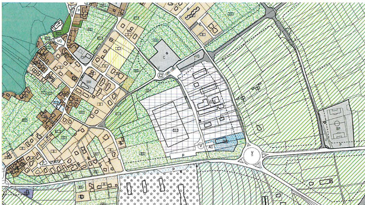
Insiediamento di Sequals

PLANIMETRIA ESTRATTO PRGC VIGENTE CON INDIVIDUAZIONE AMBITO DI ATTIVAZIONE DEL CONSORZIO